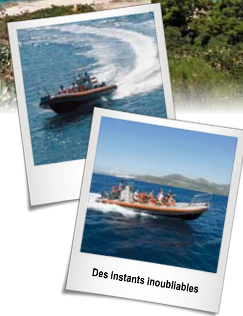
Des instants inoubliables