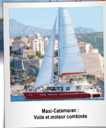
Maxi-Catamaran : Voile et moteur combinés