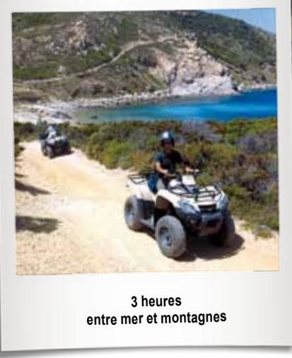
3 heures entre mer et montagnes

Partez pour une promenade magnifique de près de 3 heures entre mer et montagnes.