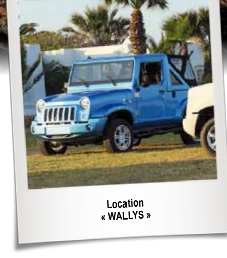
Location « WALLYS »

Visitez la Corse et amusez vous au volant de la voiture idéale pour vos vacances :