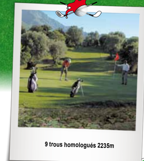
9 trous homologués 2235m