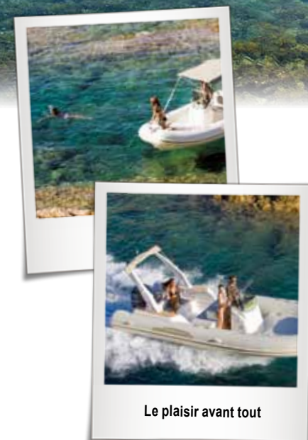
Le plaisir avant tout