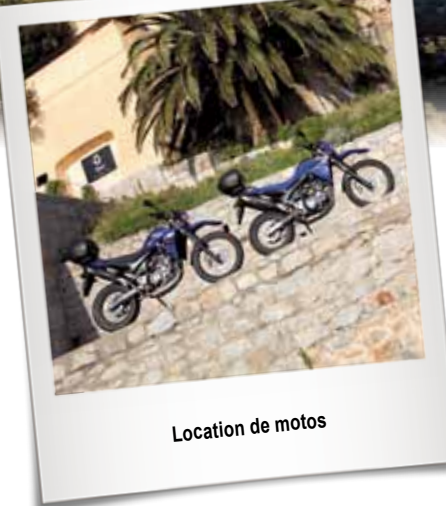
Location de motos

Visitez la Corse avec une moto agréable à conduire et confortable pour deux personnes.