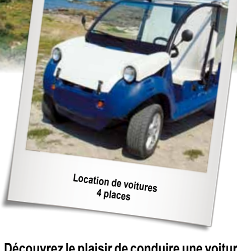
Location de voitures 4 places

Découvrez le plaisir de conduire une voiture décapotable sur les routes Corses.