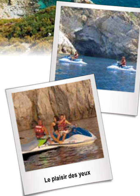
Le plaisir des yeux

Au cours de cette croisière de 3 heures, vous découvrirez une région rocheuse et sauvage classée au Patrimoine Mondial de l'Unesco. La côte abrite la Réserve de Scandola, où faune et flore sont précieusement protégées.