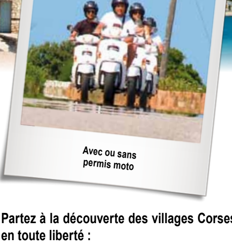
Avec ou sans permis moto

Partez à la découverte des villages Corses en toute liberté :